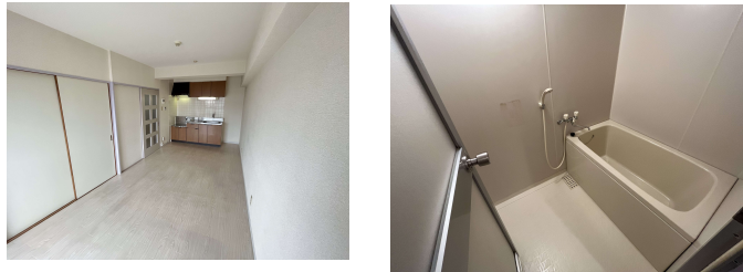
この図面は物件情報の一部を抜粋しております（現況優先） 付帯条件や別途料金が発生する場合がありますのでご確認ください